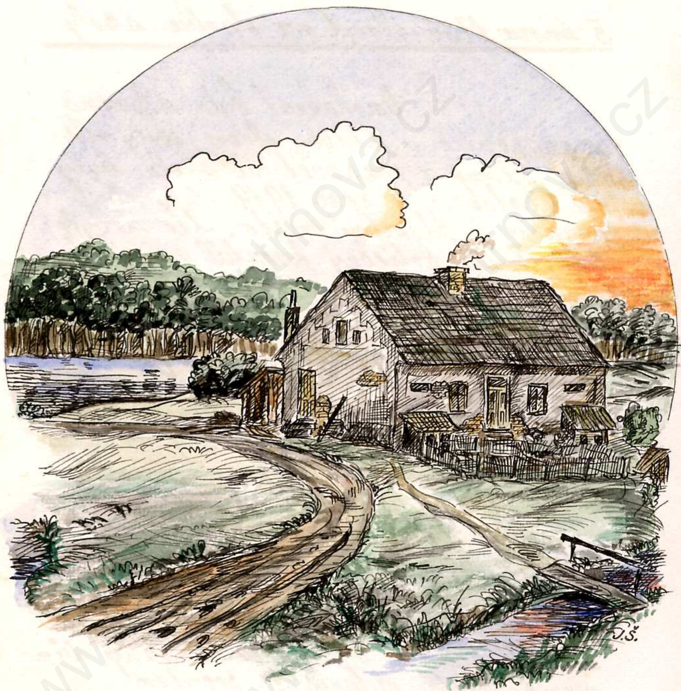
ОБЕЦНІ ДŮМ Ч. П. 26 . ЗВАНЫ «НАМР»