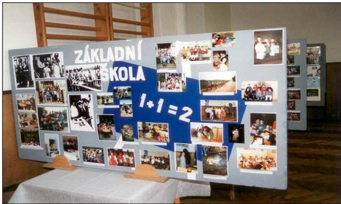
Vernisáž výstavy v prostorách školy