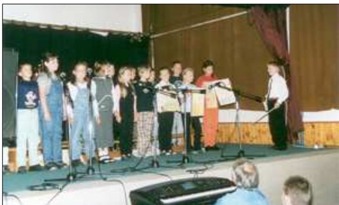
Vystoupení žáků ZŠ