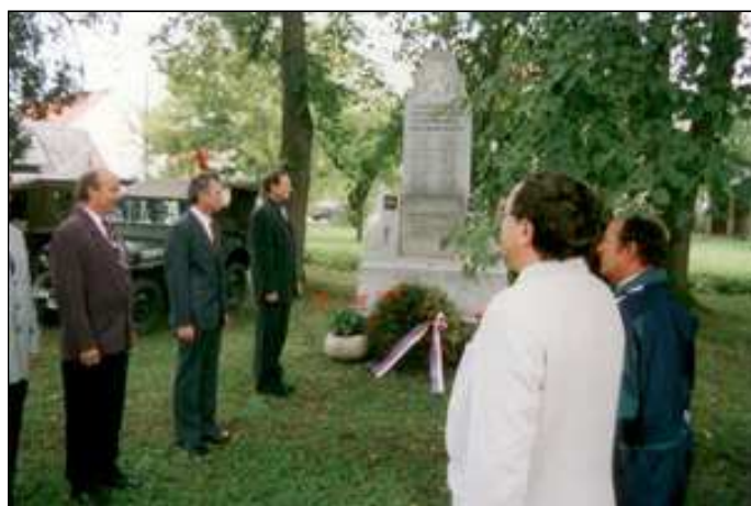
Členové OZ Trnová položili věnec u pomníku padlých v 1. světové válce