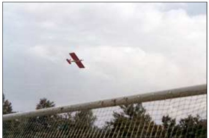
Vystoupení leteckých modelářů