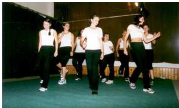
Vystoupení cvičenek oddílu Sport pro všechny