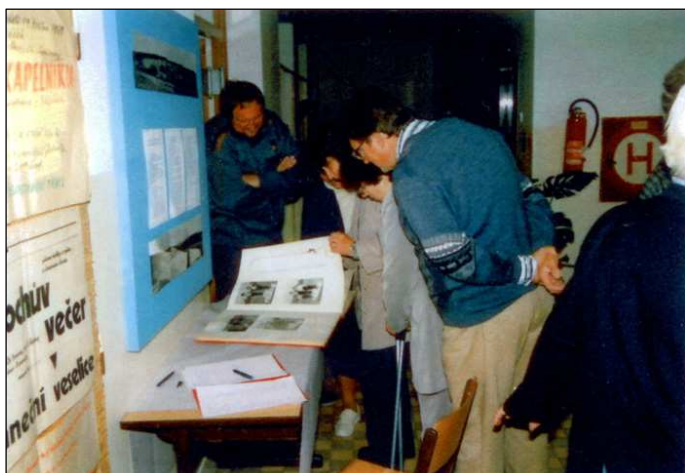
Návštěvníci vernisáže při podepisování prezenčních seznamů, které budou založeny v pamětní knize