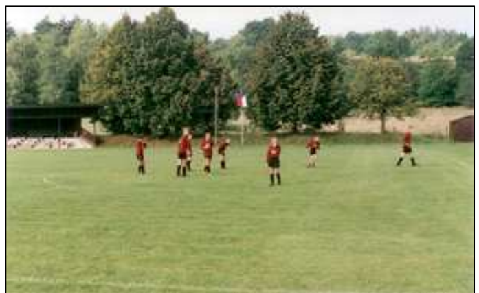
Žáci před fotbalovým utkáním