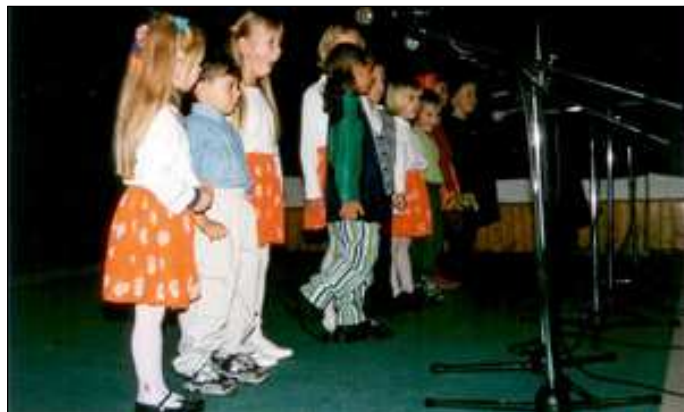
Vystoupení žáků MŠ