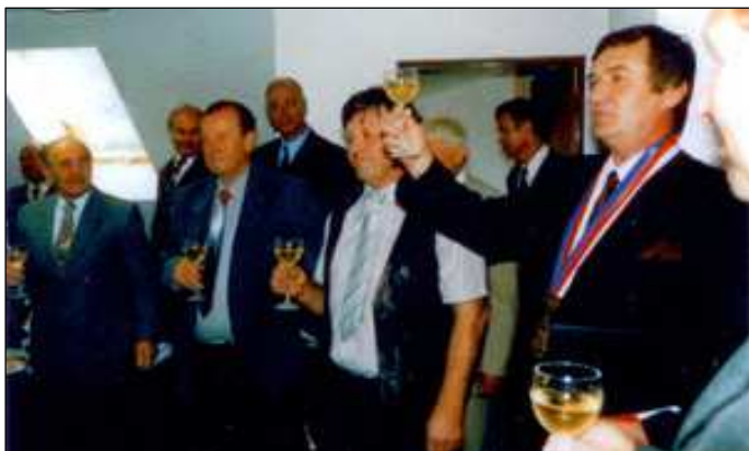
Starosta pronáší slavnostní přípitek na zdárný průběh oslav a rozvoj obce v dalších letech