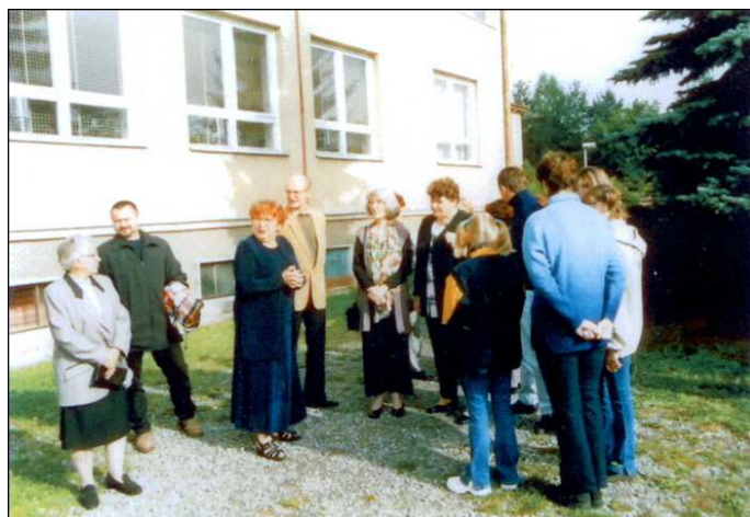
Zájemci o výstavu čekají před ZŠ na otevření vernisáže