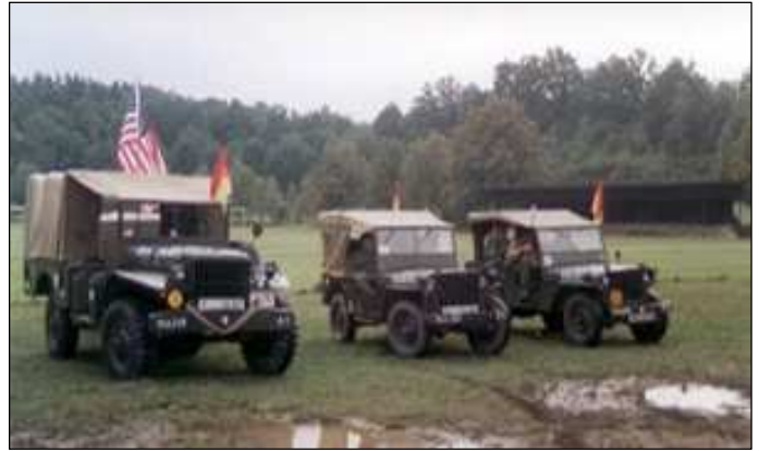
Členové Military car clubu předvedli část bojové techniky z druhé světové války