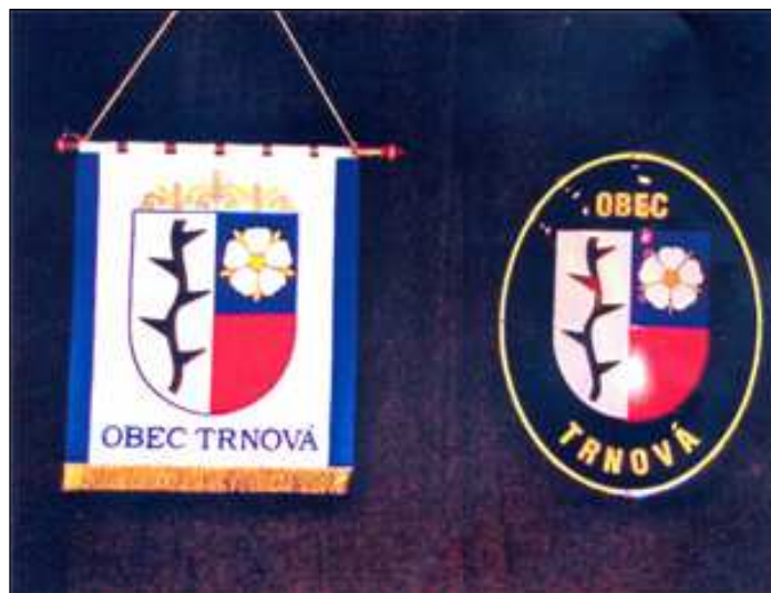
Vlevo stolní vlaječka naší obce, vpravo smaltový znak na budovu OÚ