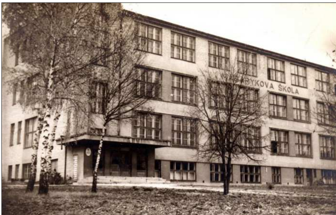
MĚŠŤANSKÁ ŠKOLA V HORNÍ BŘÍZE - školu projektoval architekt Hanuš Zápál. Vyučování bylo zahájeno 1.9.1931. Škola dostala název po 1. prezidentovi naší republiky: MASARYKOVA ŠKOLA