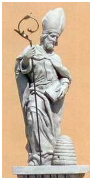
Svatý Ambrož patron včelařů

Soužití člověka a včel sahá do daleké minulosti, lépe řečeno člověka a medu, neboť plásty s medem byly lidem tehdy bližší než samotné včely. Včely žily v nepřístupných hvozdech a v pralesích v dutinách stromů. Ohrožovali je někteří příslušníci živočišné říše, zejména medvědi a lidé, kteří jim brali med a ničili jejich společenství. Zákony vnitřního života včel, jejich pudy a uspořádání jejich kolektivních pravidel jsou stejné dnes jako před mnoha tisíci lety. Postupem času lidé začali vyhledávat duté stromy blíže svých obydlí, do zdravých stromů zhotovovali dutiny, do kterých usazovali včelí roje. Lípa jako medonosný strom byla často i úlem, protože její kmen s velkými dutinami, zvaný klát se stal pro včely přirozeným útočištěm a tak se začínaly psát dějiny včelařství související s dějinami a rozvojem lidské společnosti.