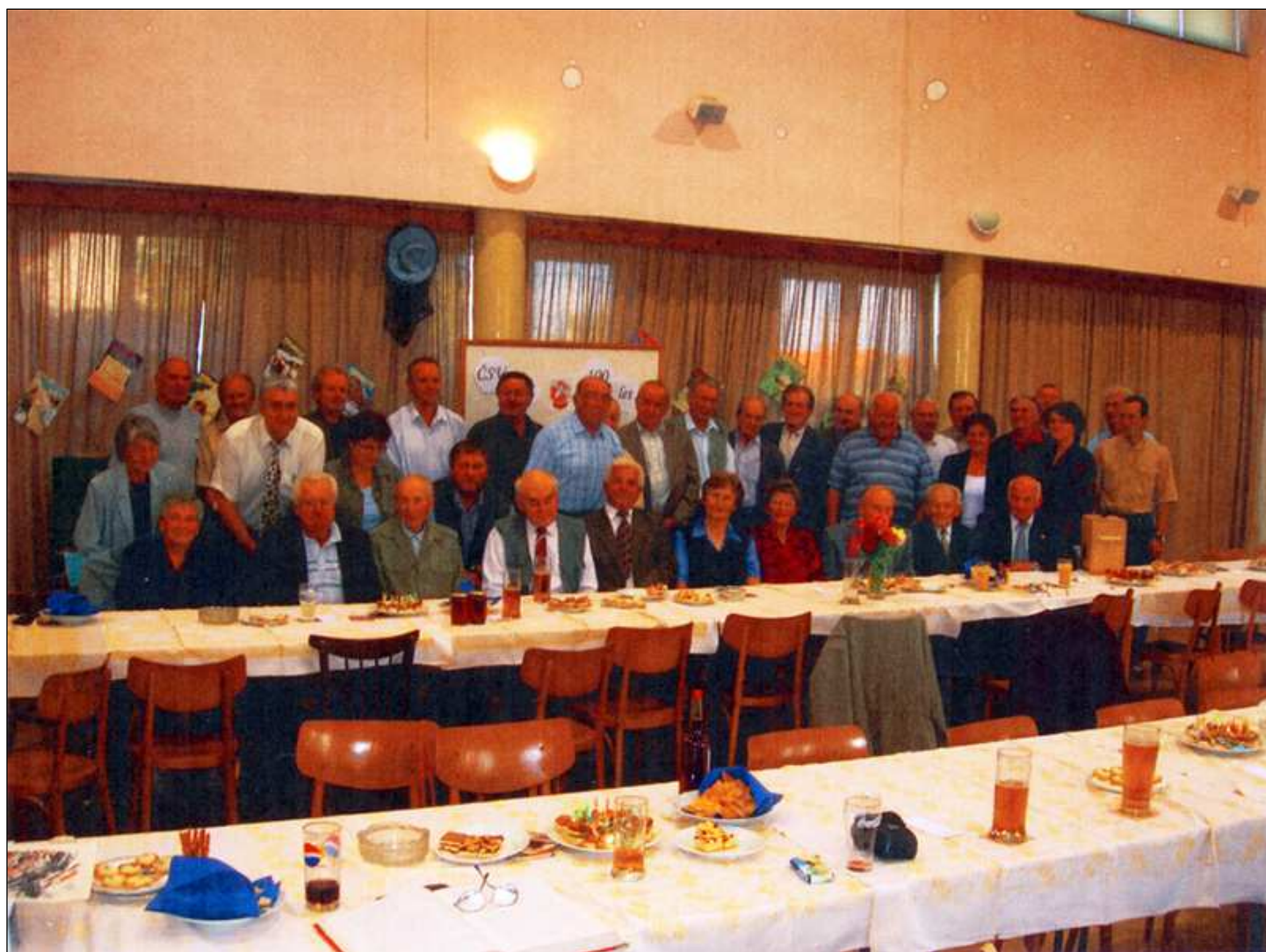
Fotografie pořízená 25.září 2005 při příležitosti oslav 100 let od založení Českého svazu včelařů základní organizace Bučí