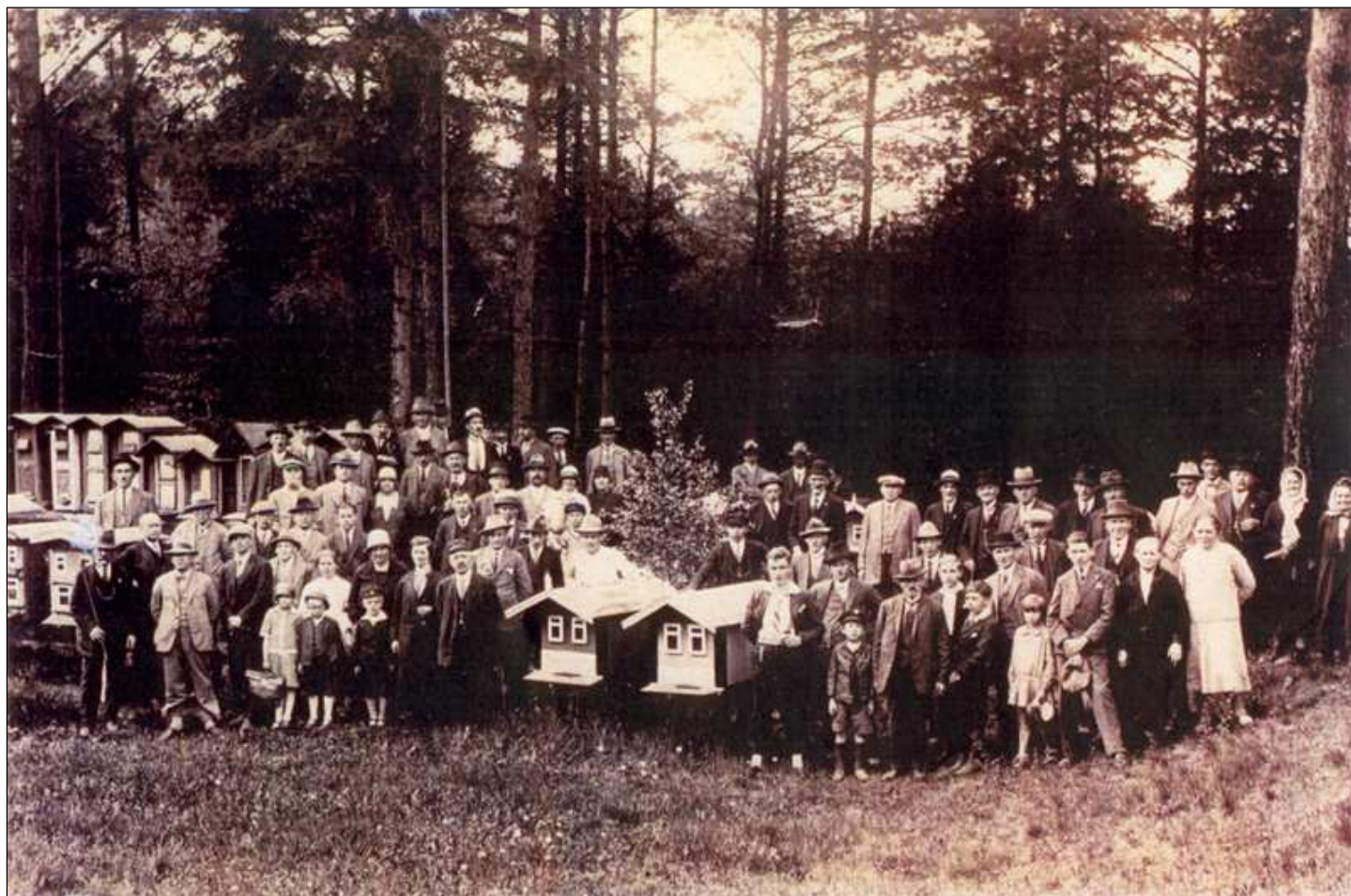
Fotografie pořízená v roce 1912 na včelnici přítele Dyka v Bučí

Z počátku byli členy našeho spolku včelaři z velkého okolí – Hůrky, Špankov, Lité, Dražeň, Manětín, Tlucná, Horní Bělá, Vrtbo, Dolní Bělá, Loza, Lomnička, Mrtník, Kaznějov, Bučí, Trnová, Visky, Horní Bříza, Tatiná, Žilov, Ledce.