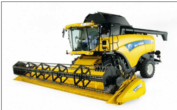
je jedním z mnoha nabízených druhů kombajnů pro sklizeň na trhu