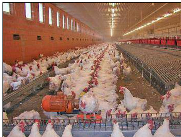
Pohled do moderní velkokapacitní drůbežárny.