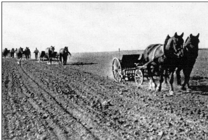
Společné osevy - první krok k družstevní velkovýrobě.