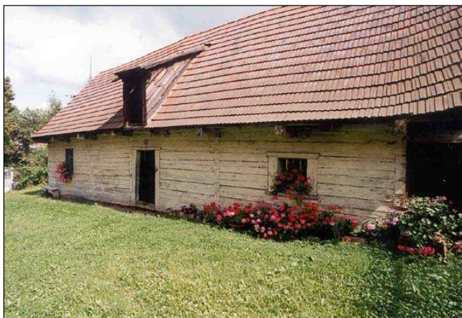
Roubené stavení - nejstarší dům v obci Trnová č.p. 2. Krytina střechy není původní.