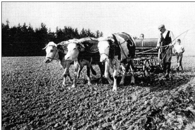
Tak seli kdysi naši zemědělci.