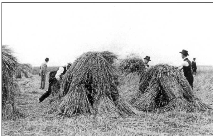
Orba pluhem a sklizeň obilí na počátku 20. století.