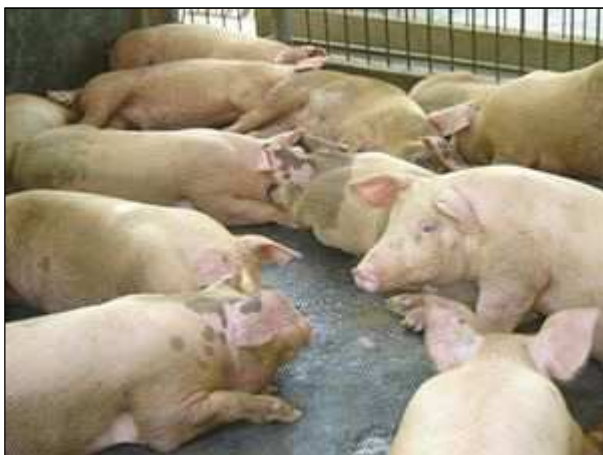
Rodinné farmy chovají v menších počtech též vepře.

V poslední době lze pozorovat též rozmáhající se chovy ovcí, a to i přes nízké výkupní ceny vlny.