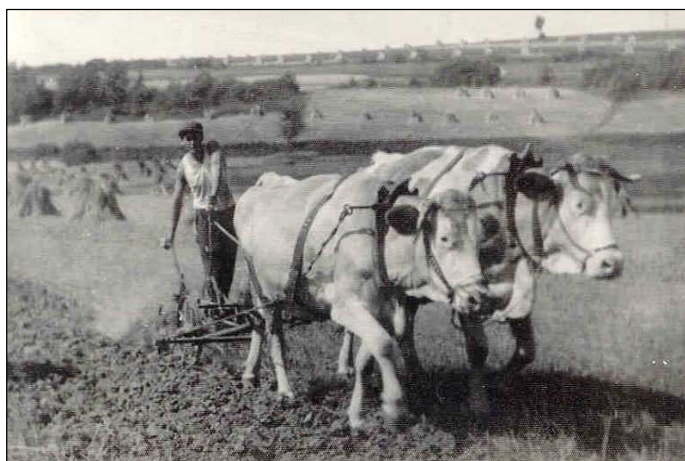
Na fotografii pan Frundl pluhem taženým kravským potahem provádí orbu svého záhumnku. V pozadí jsou vidět pole, na kterých stojí v "panáčích" posečené obilí. Snímky jsou z 50. let 20. století.