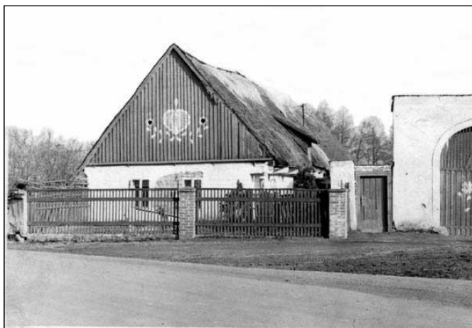
Bývalé č.p. 1. Roubené stavení, částečně omítnuté. Střecha je došková.