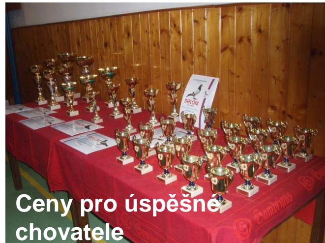
Ceny pro úspěšné chovatele