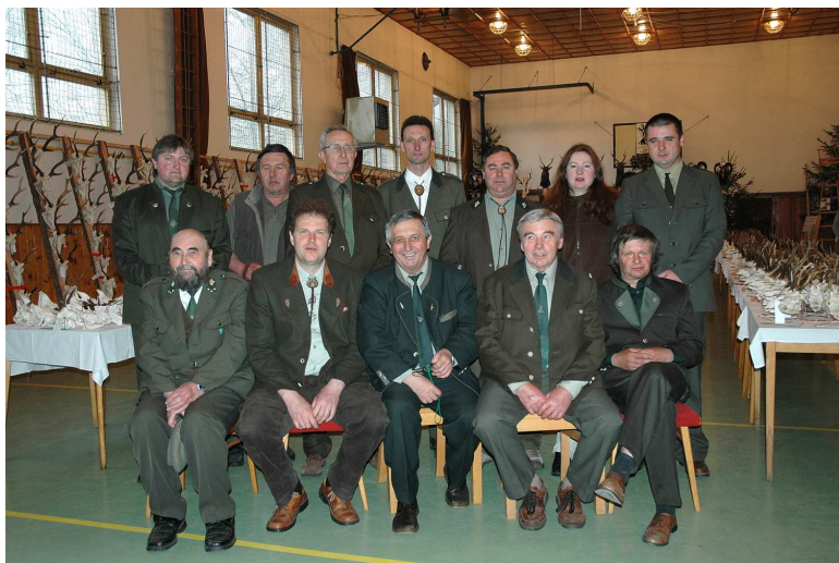
Členové spolku při okresní výstavě trofejí v tělocvičně TJ v roce 2006

Tento spolek působí v obci samostatně od počátku 90. let minulého století, výměra honitby činí cca 900 ha.