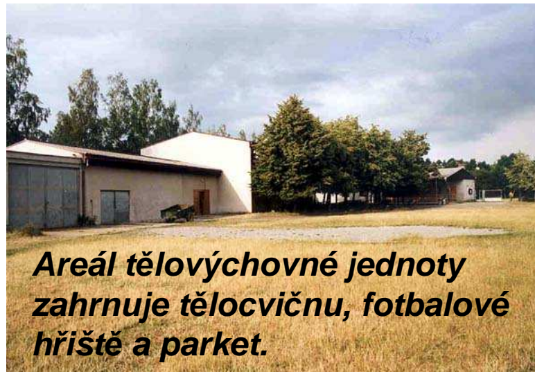
Areál tělovýchovné jednoty zahrnuje tělocvičnu, fotbalové hřiště a parket.