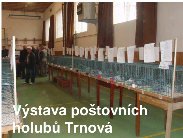
Výstava poštovních holubů Trnová

Tento spolek působí v obci od roku 1997, jeho členové již dosáhli mnohých významných úspěchů. Pravidelně se zúčastňují závodů poštovních holubů)