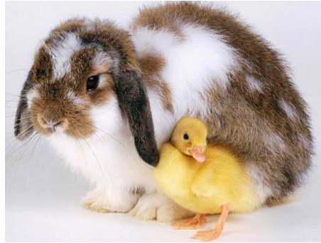
Bunny and chick