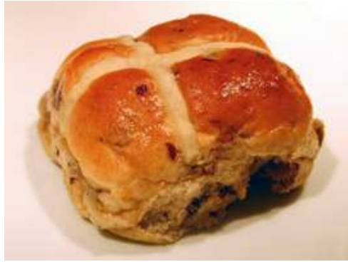
Hot cross bun